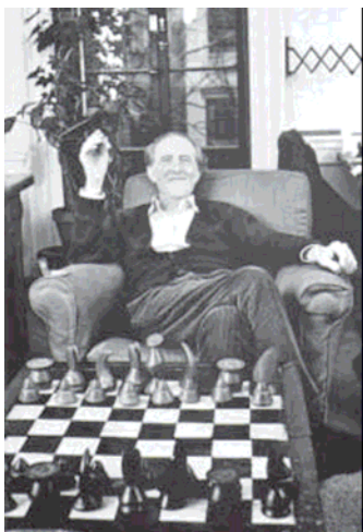
Dos grandes artistas que fueron buenos aficionados al ajedrez. En la foto, Marcel Duchamp frente al juego de piezas que diseñara y le regalara Max Ernst

Aunque Cage no se consideraba dadaísta fue amigo de Marcel Duchamp, otro destructor del arte tradicional pero en el ámbito de la plástica, con el cual jugó públicamente al ajedrez con un tablero organizado mediante procedimientos aleatorios (recuérdese que años más tarde el gran ajedrecista Bobby Fischer propuso colocar las piezas aleatoriamente en las primera y octava filas del tablero con el propósito principal de sacar a los jugadores de las aperturas rutinarias). La Música para Marcel Duchamp es de 1947, dura alrededor de 5 y medio minutos y es para piano preparado.